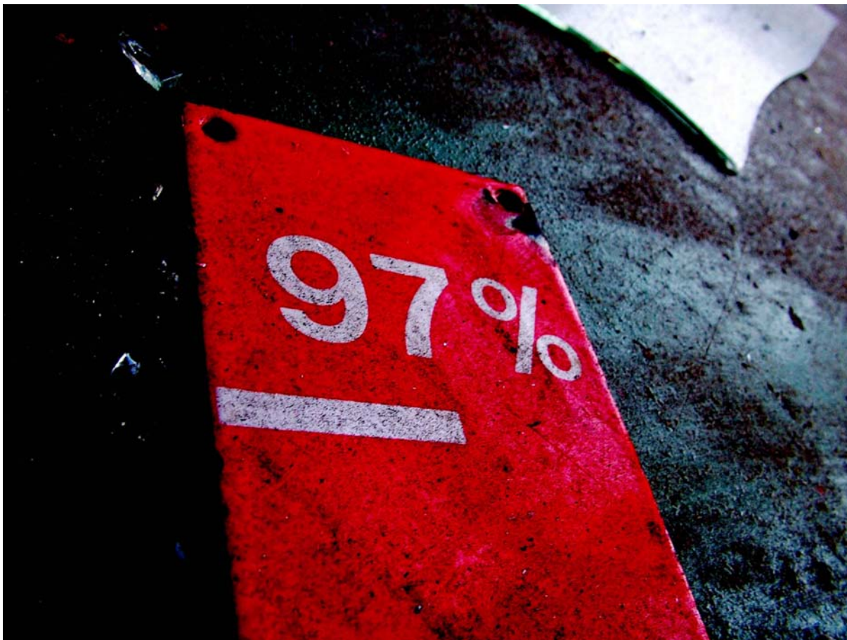
Gestione provvigioni agenti con RADIX liquidazione provvigioni